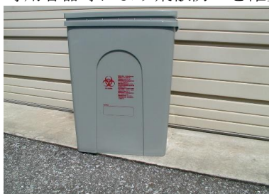
感染性医療廃棄物容器